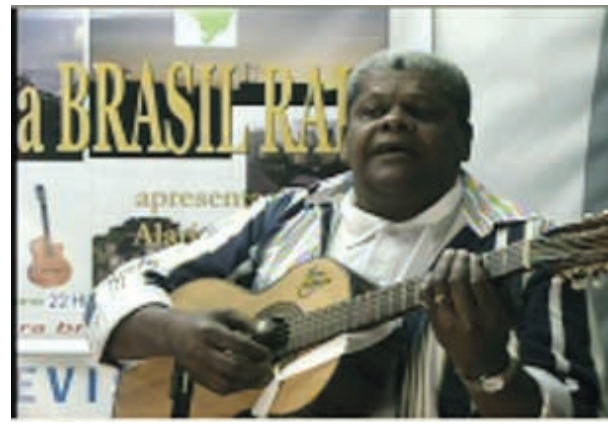
Reprodução de imagem do "Programa Brasil Raiz", de Alarico Rezende: o Mano Vêio Pena Branca cantou Cuitelinho e O Cio da Terra, no dia 27 de agosto de 2008, pela webtv (www.tvbahamas.com.br), em São Paulo

Pena Branca chegou a ser levado ao Hospital São Luiz Gonzaga, no Jaçanã, mas não resistiu e faleceu.